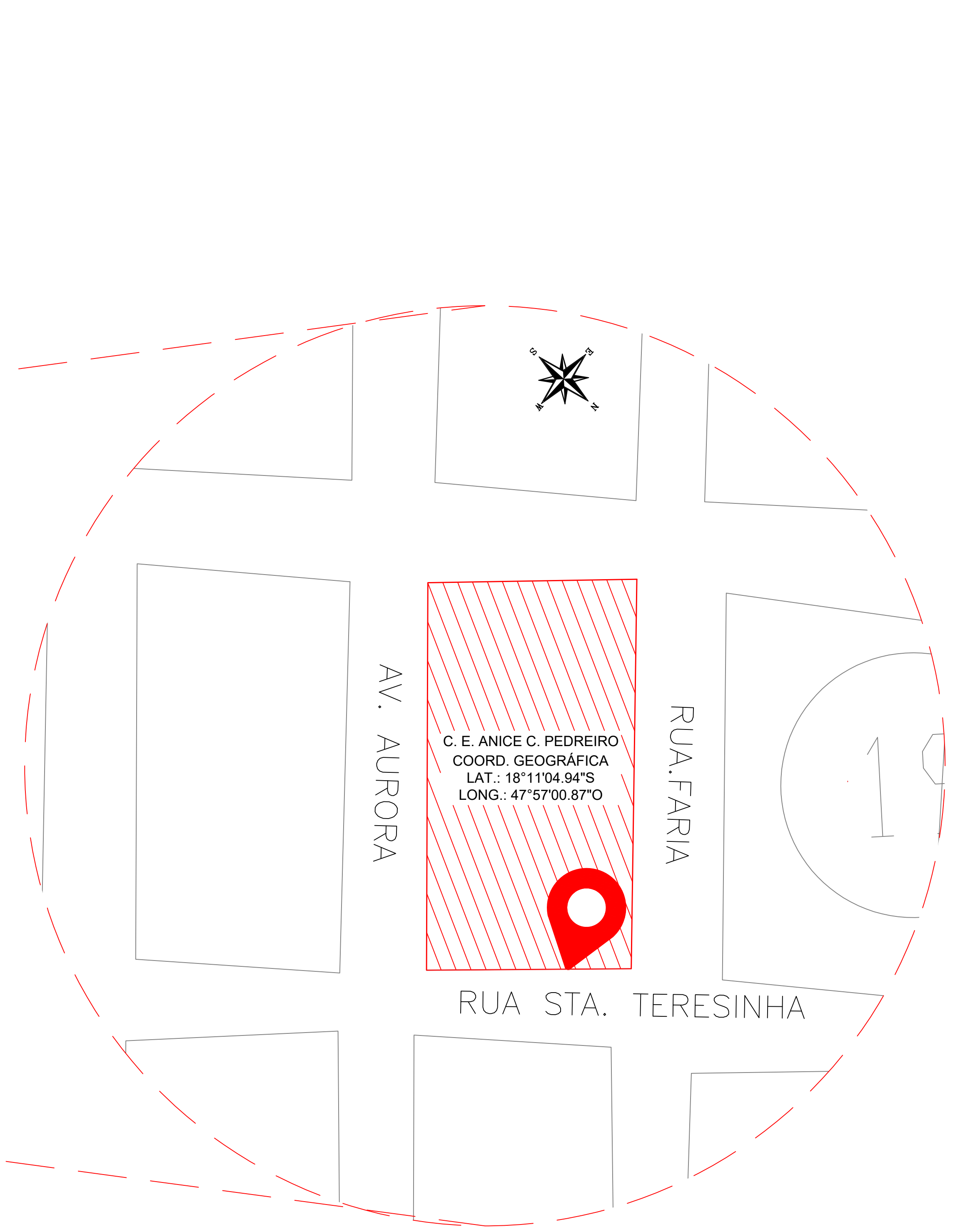
PLANTA DE SITUAÇÃO ESCALA 1:1750